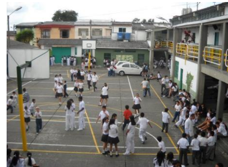
SEDE CIUDAD ARMENIA