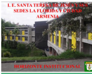
SEDE SANTA TERESA de JESUS